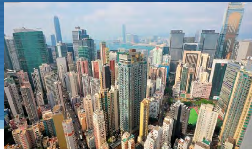
陳茂波表示，現時取消樓市辣招是言之尚早。